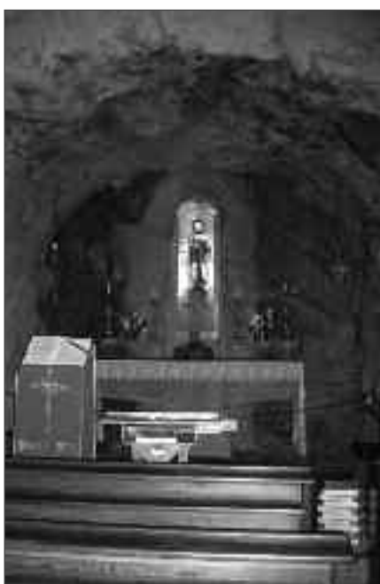
La Grotta di San Giovanni

piglia Cervo grazie alla devozione e al lavoro di generazioni di abitanti. L'inizio della costruzione della Chiesa risale ai primi del Seicento, dove un tempo sorgeva un antico sacello, e continuò nel Settecento, quando furono ampliati la sacrestia e il coro seguendo il progetto dell'architetto Bernardo Vittone. La Chiesa si presenta con un'unica navata e con due cappelle su ogni lato, dedicate a Santa Elisabetta, San Zaccaria e ai genitori di Gesù, Maria Immacolata e San Giuseppe. La copertura è costituita da volte a vela e tra i materiali usati per la costruzione, oltre alla pietra locale, fu fatto largo utilizzo di marmo bianco, estratto dalla vicina cava del Mazzucco, soprattutto per la costruzione degli architravi, dei pavimenti del coro e delle pile dell'acqua santa. Nella parte destra si trova la suggestiva cappella del Santo, scavata nella roccia e contenente una statua lignea raffigurante San Giovanni Battista. Attualmente il Santuario di San Giovanni d'Andorno rappresenta uno dei più importanti luoghi devozionali dell'Alto Cervo, oltre che punto di riferimento e centro morale per la comunità della vallata.