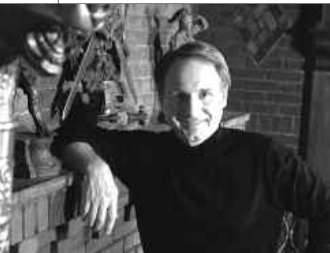
Dan Brown

Codice Dan Brown, giacca di tweed, golfino blu, camicia azzurra button down, pantaloni kaki, mocassini bordeaux. Che sia in realtà lui il professore di Harvard protagonista dei suoi libri? "No, non sono io Robert Langdon, anche se mi piacerebbe molto esserlo. Ma la verità è che lui ha molto più coraggio di me ed è anche decisamente più intelligente per interpretare un simbolo ci mette un attimo, io devo fare ricerche infinite".