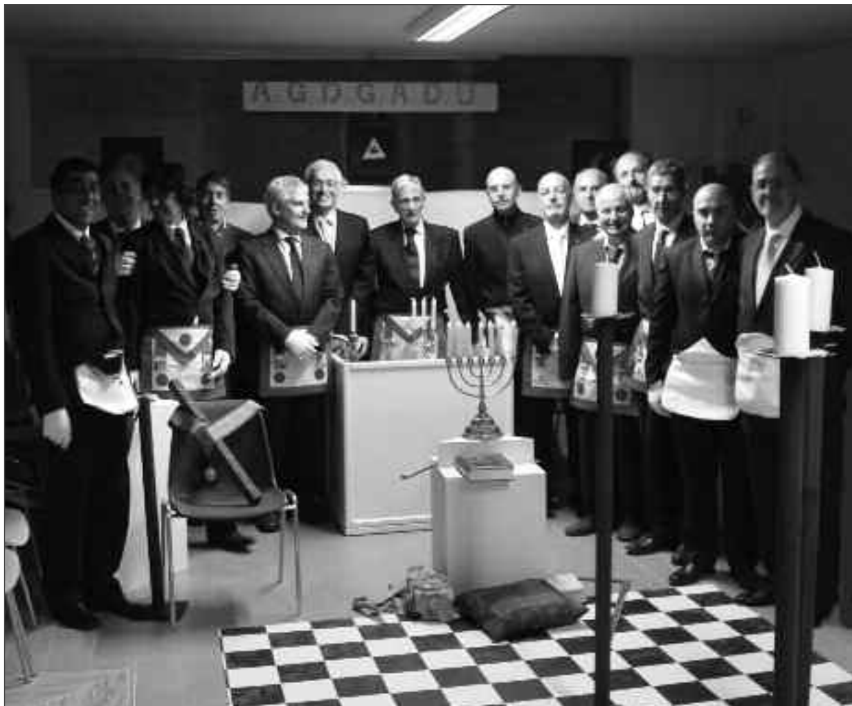
Tre momenti della ripresa dei lavori nella nuova sede