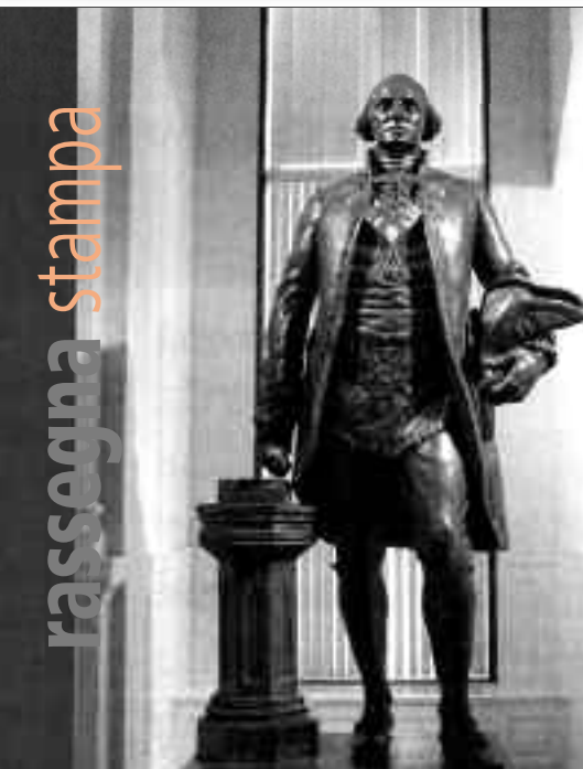
Statua Bronzea al George Washington Museum nel George Washington Masonic National Memorial, Alexandria, Virginia (USA).

ogni iniziato possa interrogarsi dinanzi alle grandi questioni ontologiche del vivere, favorendo un percorso interminabile di risveglio (auto)critico e di permanente dubbio interiore. Le risposte non vengono dalla Massoneria; se fosse così saremmo una Chiesa, ma questo non è il nostro compito. Diciamo che alcu-