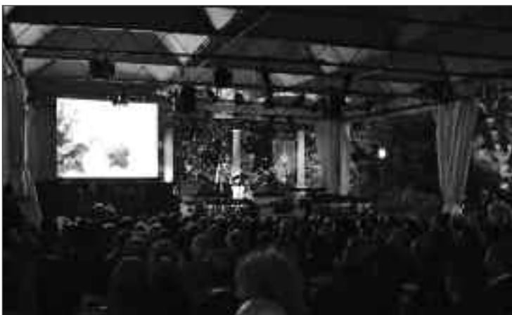
Proiezione del film