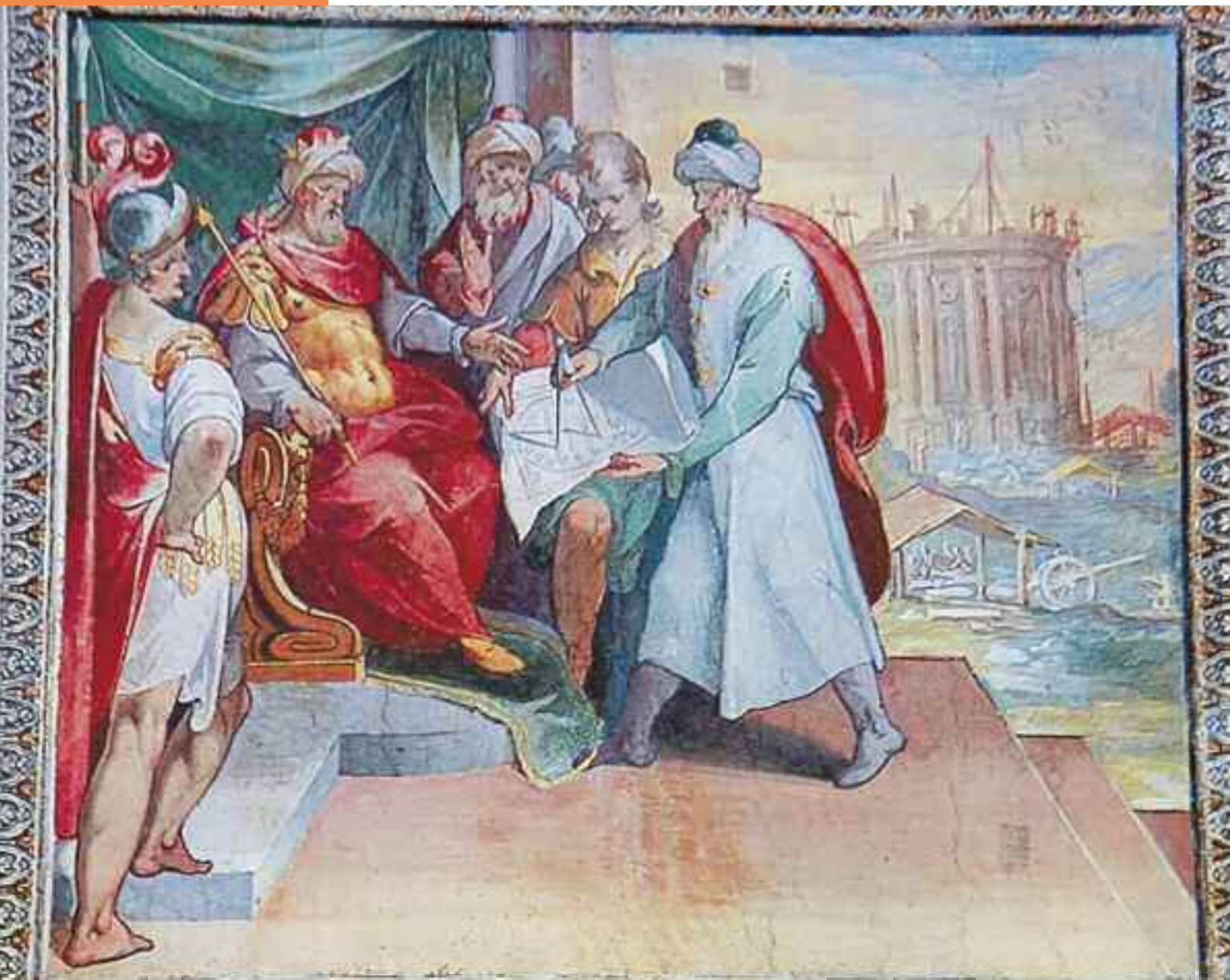
Attr. Giovanni Battista Ricci da Novara e Ludovico Lanzone, Hiram presenta al re Salomone il progetto del tempio in costruzione , 1585-87, Volta della Galleria di Palazzo Vento-Giustiniani. L'immagine è stata riprodotta nella copertina del libro di Carla Benocci, Nel tempio di Salomone. Le pitture con temi proto-massonici nelle residenze romane cinque-secentesche , Erasmio Edizioni, 2008, presentato a Villa Il Vascello il 29 ottobre dal Servizio Biblioteca del Grande Oriente d'Italia

Bollettino d'informazione del Grande Oriente d'Italia