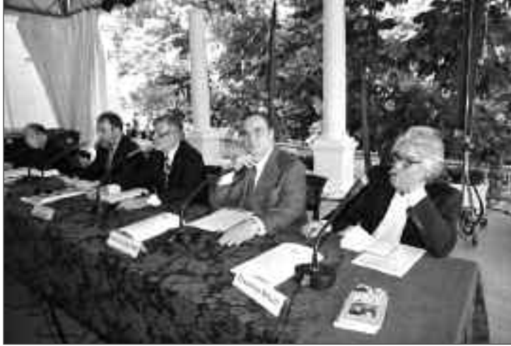
Tavolo dei relatori

zita solo verso l'anno 1000 dopo la promulgazione di un decreto del Rabino di Magonza, Gershom. Ma la comunità sefardita ha continuato sino ad epoca recente a praticare tale costume. Potrebbe sconcertare il fatto che a Feltre, nel lontano, ma poi non troppo, 1578, il vescovo autorizzasse un ebreo a prendere una seconda consorte conformemente alla "legge del sacrosanto Antico Testamento". Ma allora, tale uso legittimato dalle scritture sarebbe stato contro natura? E le civiltà che ricorrono alla poliandria, come quella tibetana? Sono contro natura? E' evidente che nei comportamenti umani la natura è strettamente mediata dalla cultura. La famiglia naturale, che non esiste a priori, ha assunto aspetti talmente diversi nella storia della civiltà che non può essere appiattita sul modello occidentale affermatosi con il cristianesimo. Le religioni a loro volta hanno normato gli usi culturali e hanno negoziato con la realtà,