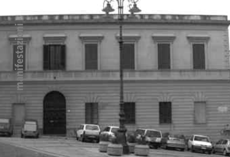
Palazzo Sanjust, sede prestigiosa del Collegio circoscrizionale della Sardegna a Cagliari, nell'antico quartiere Castello