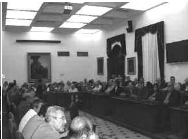
Due momenti del convegno