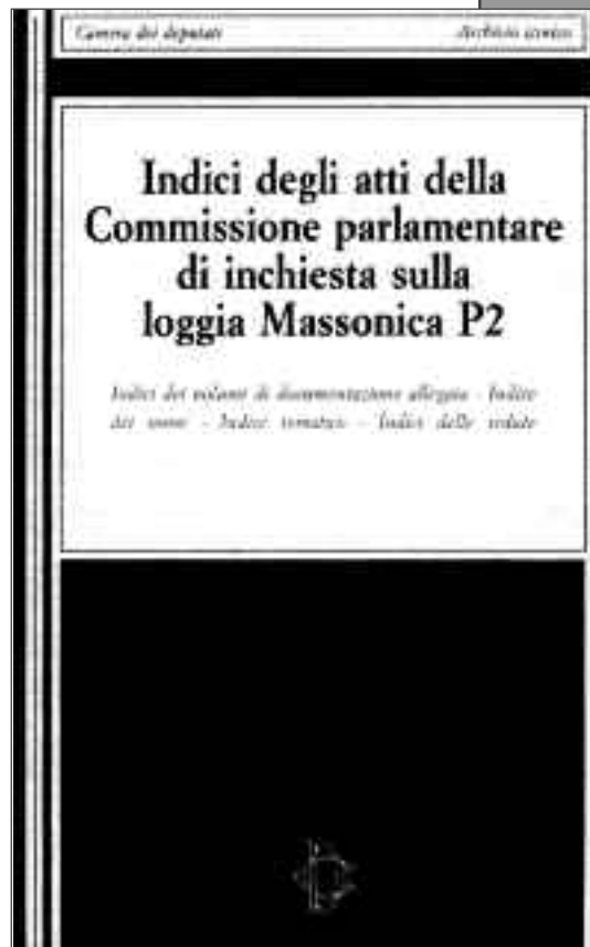
La questione P2 segnò un momento difficile per il Grande Oriente d'Italia. Nata come loggia, divenne in seguito un organismo totalmente indipendente, ma il fatto che non sia stata immediatamente sconfessata né denunciata pubblicamente come fenomeno controiniziativo ed estraneo al mondo massonico, provocò un grave colpo all'immagine dell'Istituzione

Grande Oriente da parte del mondo politico giornalistico, il quale, da parte sua, nascondeva ben altri scheletri nei propri armadi. A quel punto era comunque necessario fronteggiare la valanga di accuse e insinuazioni che con grande compiacimento i media riversavano sulla Massoneria italiana. Corona provvide innanzitutto a rintuzzare con una serie di querele le calunnie più smaccatamente false. Quindi il nuovo Gran Maestro, assai sensibile alla pubblica opinione ma assai meno data anche la sua limitata anzianità massonica alla continuità della tradizione, si dispose a introdurre rapidamente quelle modifiche normative che potevano assicurare all'Ordine una maggiore funzionalità e una più solida protezione dagli addebiti impropri che le venivano rivolti. Inoltre, allo scopo di ridare al Comunione un'immagine dignitosa si cominciò anche a prendere in considerazione l'uso di un altro strumento di riqualificazione dell'Istituzione, di cui il Gran Maestro, pur non essendo uno studioso di discipline storiche o filosofiche, intuiva la grande importanza: lo strumento culturale. Nel 1984 fu varata la nuova Costituzione col relativo regolamento. Fra le innovazioni più rilevanti figuravano: l'abolizione del giuramento e dei "cappucci e delle spade"; il cambiamento del meccanismo elettorale, congegnato in modo da ostacolare i condizionamenti che si erano verificati all'epoca di Salvini, introducendo l'elezione diretta e, nell'ipote-