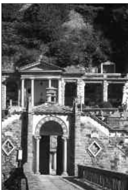
L'ingresso del Cimitero