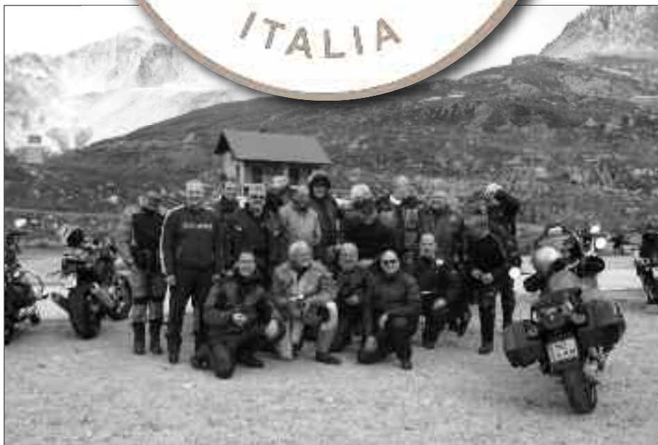
Il gruppo di motociclisti massoni