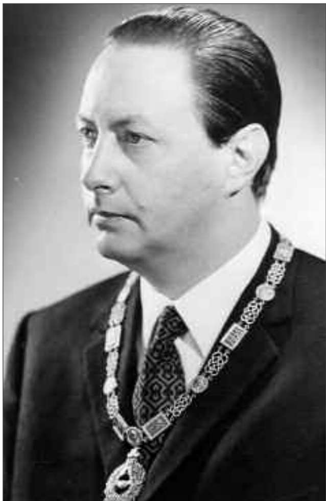
Il Gran Maestro Lino Salvini

sempre sottoposta ai doveri e ai diritti di tutte le altre officine del Grande Oriente) per assumere via via quelle di un aggregato – che non si riuniva mai – composto di ufficiali, generali, politici, alti funzionari, banchieri, affaristi, giornalisti e vip fuori da ogni controllo costituzionale e senza rapporti con gli altri fratelli della Comunione giustiniana. Tuttavia, essendo protetta dal Gran Maestro e da alcuni suoi collaboratori, essa continuò a rimanere un organismo del Goi, finendo così per coinvolgere l'intera Istituzione nella sua pericolosa evoluzione e fissare nell'immaginario collettivo un giudizio negativo. A un certo punto Salvini si rese però conto che la situazione stava sfuggendogli di mano e, pensando di poter contare su un forte prestigio interno e internazionale, tentò di ridimensionare la figura di Gelli.