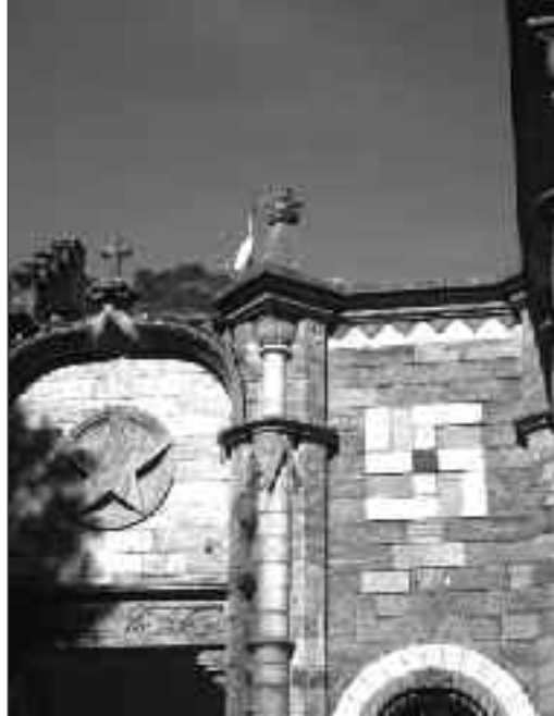
Particolare della Chiesa e la decorazione del pentalfa e della svastica