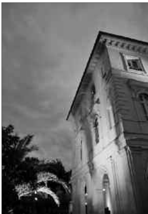
Villa Il Vascello