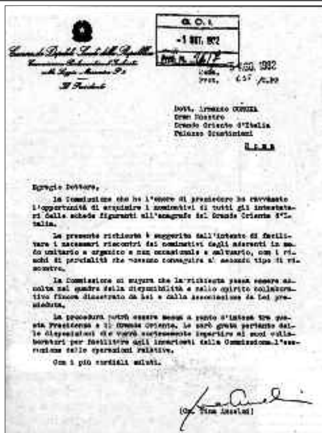
Tina Anselmi, presidente della Commissione Parlamentare d'inchiesta sulla P2, scrive al Gran Maestro Armando Corona chiedendo la collaborazione del Grande Oriente per l'acquisizione dei suoi elenchi anagrafici

guida del governo, istituì una commissione parlamentare d'inchiesta e rese operativo l'articolo 18 della Costituzione riguardante le società segrete, disponendo, con la legge n. 17 del 25 gennaio 1982, lo scioglimento della P2. Il Goi non venne colpito da alcun atto restrittivo poiché sia la commissione d'inchiesta sia la magistratura in tempi successivi ritennero che la P2 fosse una deviazione con coperture individuali e un fenomeno estraneo alla tradizione massonica giustiniana. A questa convinzione si arrivò anche grazie al ruolo svolto nella vicenda dell'espulsione di Gelli dal nuovo Gran Maestro Armando Corona, medico sardo e dirigente del Partito repubblicano eletto il 28 marzo del 1982. Amico personale di Ugo La Malfa, Corona aveva rivestito la carica di presidente della regione Sardegna ed era un politico molto esperto. Conosceva bene gran parte della classe politica italiana, ed essendo dotato di un'indubbia intelligenza e di una buona dose di astuzia non si fece impressionare né scoraggiare dal crucifige cui venne sottoposto il