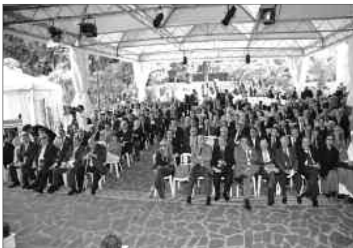
Il pubblico nel parco di Villa Il Vascello