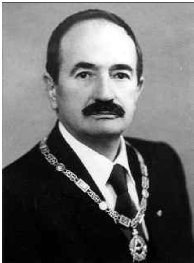
Il Gran Maestro Ennio Battelli

organismo totalmente indipendente, anche se di fatto continuava a contare su una copertura massonica dovuta al fatto che il Gran Maestro Battelli non l'aveva mai sconsigliata né denunciata pubblicamente come fenomeno controiniziativo ed estraneo al mondo massonico.