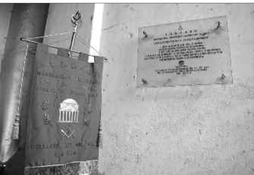
Targa del Collegio circoscrizionale del Lazio