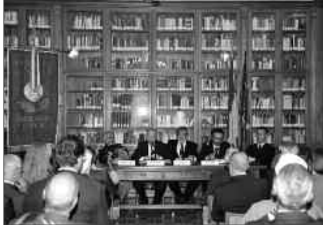
Convegno su Massoneria e Unità d'Italia

Nella stessa mattinata si è avuto a Monte Mario l'avvio simbolico dei lavori per la realizzazione del futuro Centro Polifunzionale del Grande Oriente d'Italia e la nuova sede del Collegio circoscrizionale del Lazio e delle logge romane. Era presente il Gran Maestro Gustavo Raffi accompagnato dalla Giunta del Grande Oriente d'Italia.