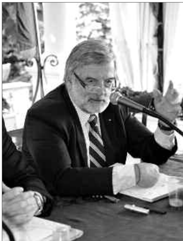
Il convegno di sabato mattina