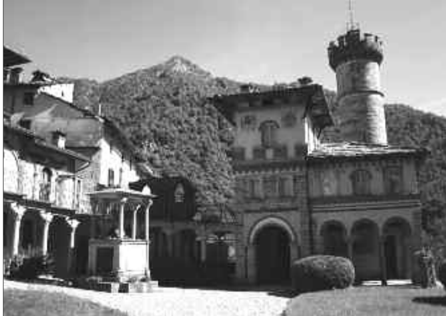
Rosazza. Il Castello caratterizzato dal suo stile tipicamente "eclettico"